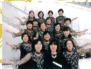
高松ときわコーラス